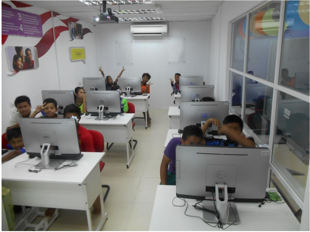
Peserta Klik dengan Bijak dengan Ms Excel 2010